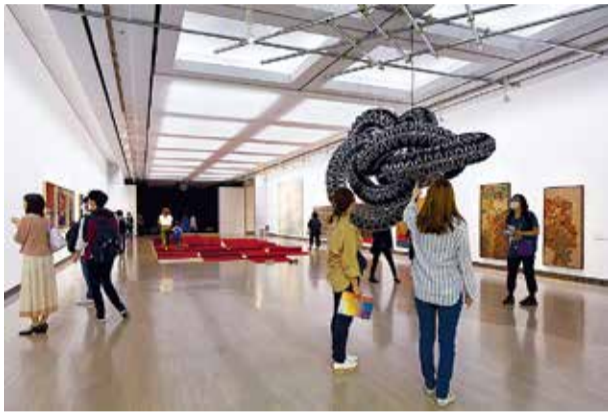
▲ヨコハマトリエンナーレ2020展示風景