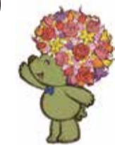
横浜の花と緑をPRする マスコットキャラクター 「ガーデンベア」